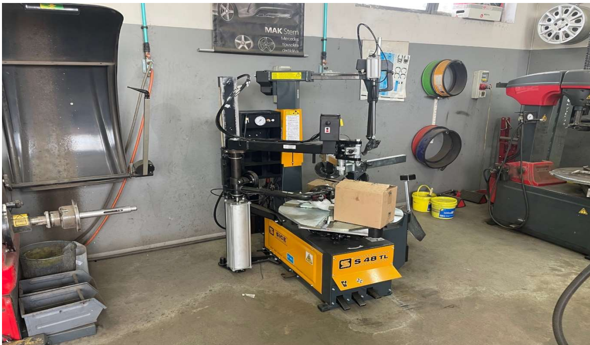
13. kép A bűzemelt SICE S48 TL Automata gumiszerelőgép