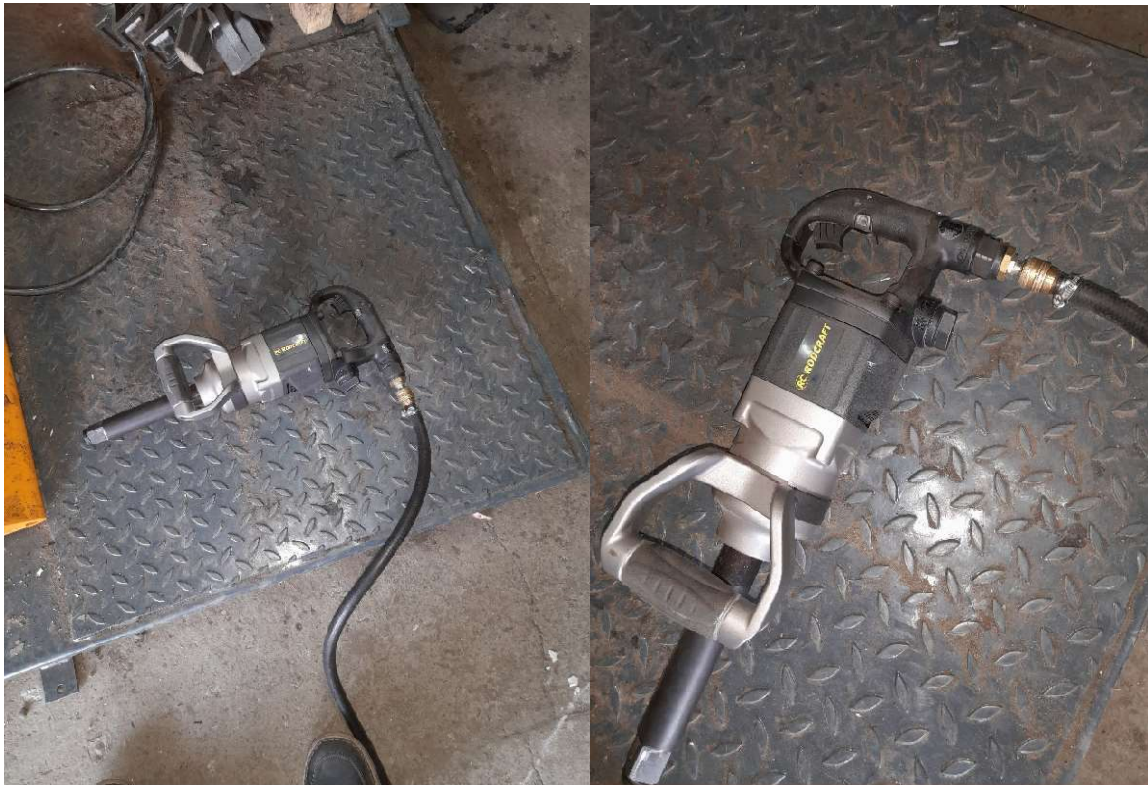
10. kép RODCRAFT RC léggulcs