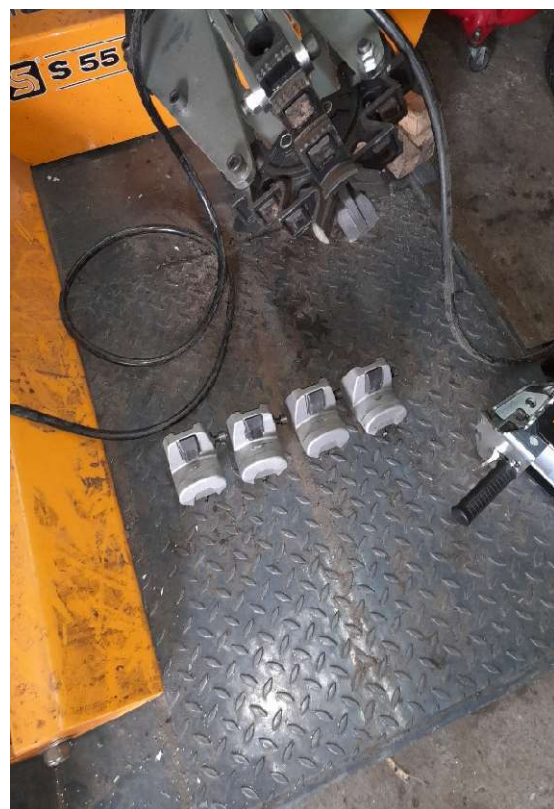
9. kép SICE S55A Haszonjármű gumiszerelőgép SICE KGL56 megfogó köröm védő készlet