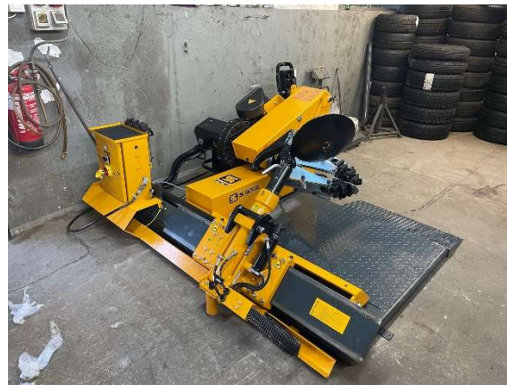
8. kép SICE S55A Haszonjármű gumiszerelőgép beüzemelése