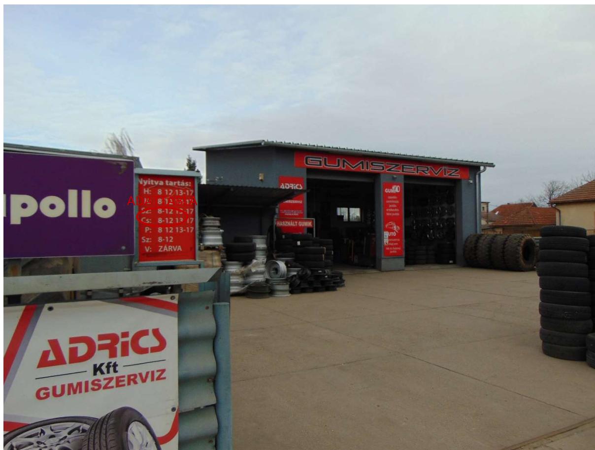
1. kép A gumiszervíz épülete a szerelőhelyekkel

Az ADRICS Kft. szerelőállásai az alábbi képen látható: