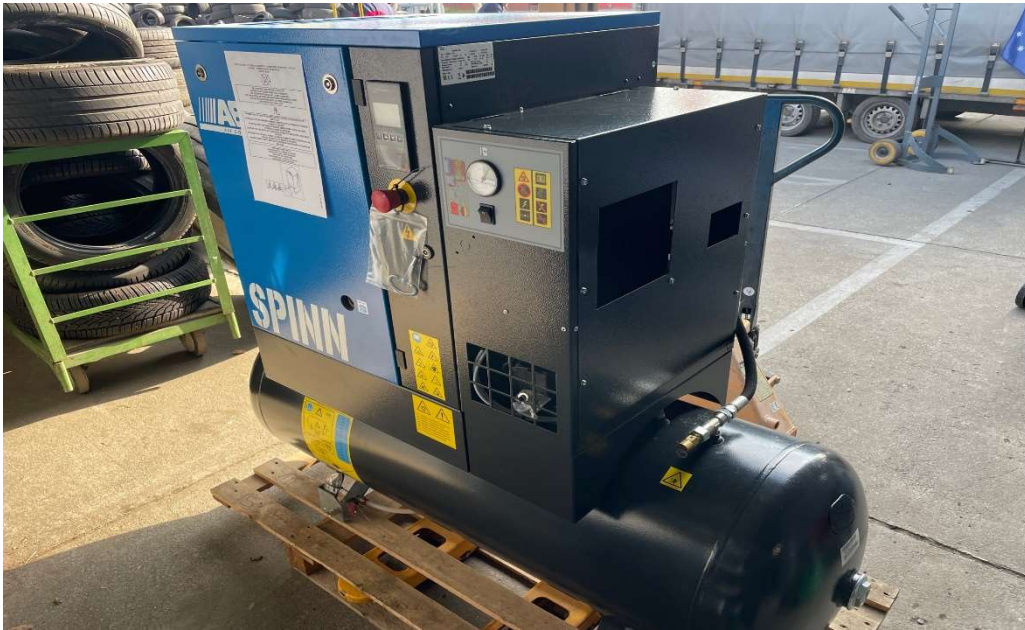
14. kép ABAC_SPINN kompresszor beérkezése