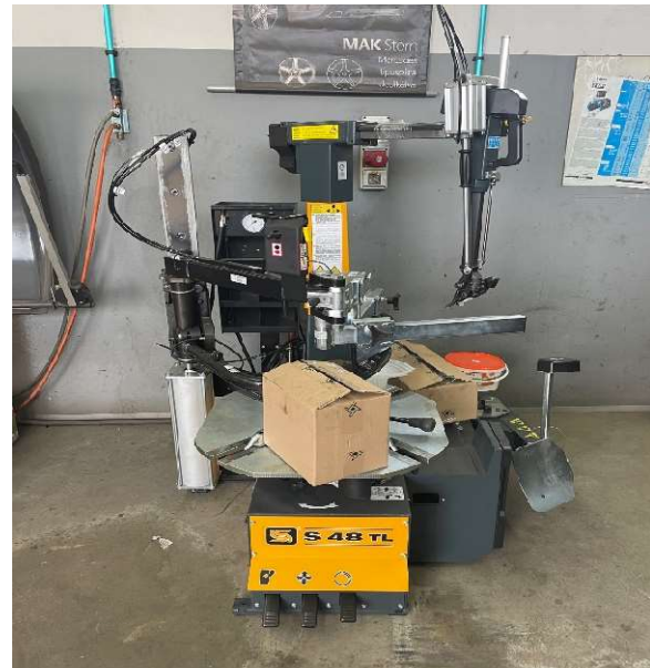
12. kép SICE S48 TL Automata gumiszerelőgép beérkezése