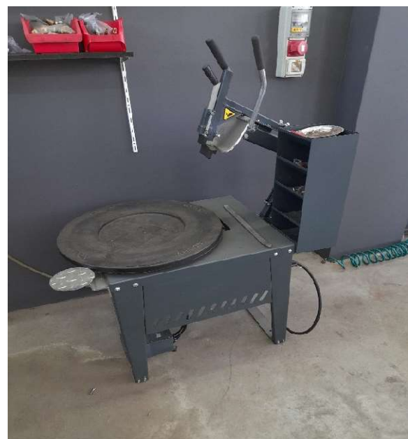
5. kép ACHON BBRT 900 peremlenyomó beérkezése, üzembehelyezése