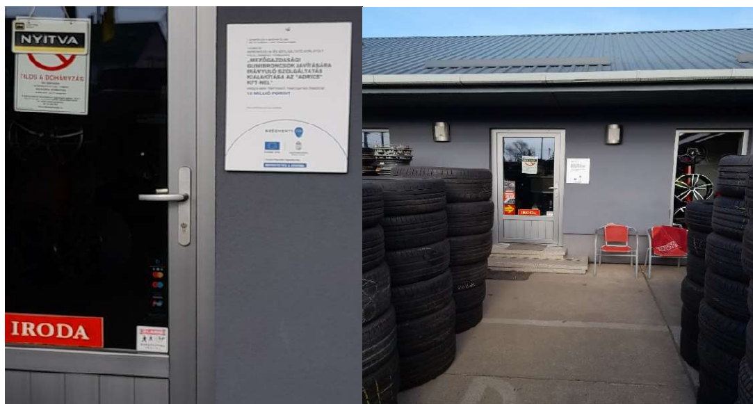
19. kép „C” típusú tábla az iroda bejárata mellett