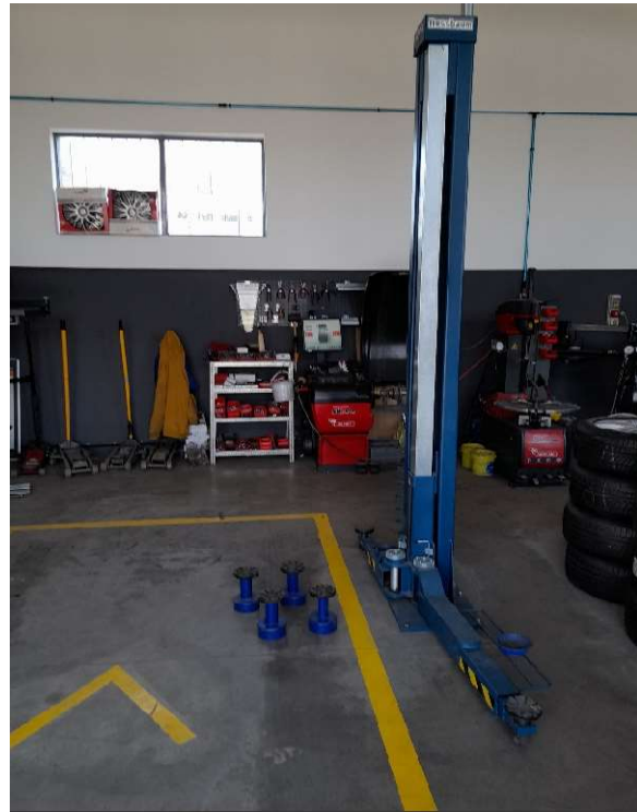
4. kép 4 db NUSSBAUM csápkar emelótányér magasító