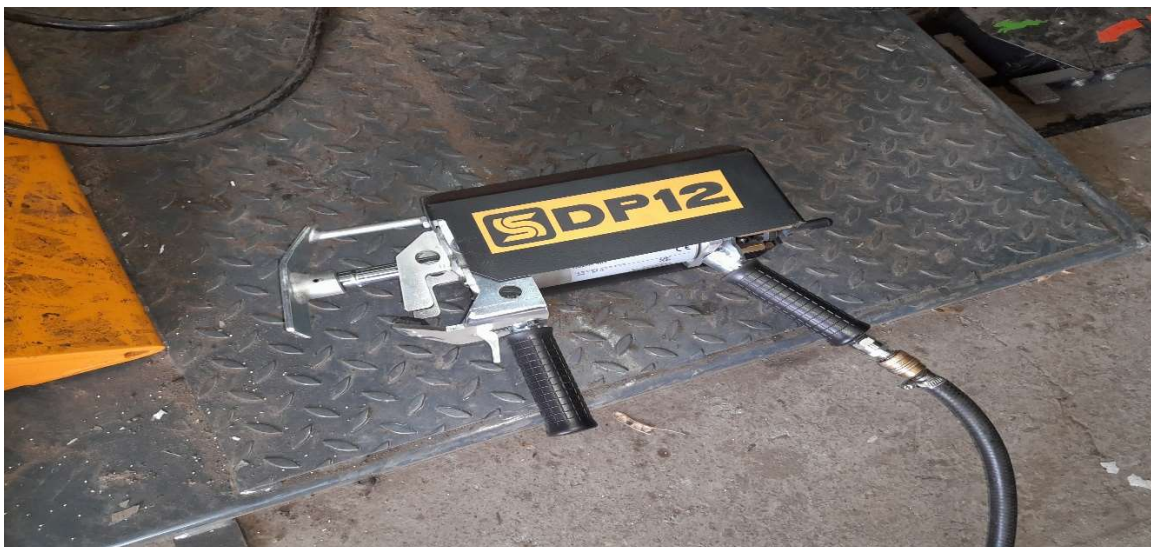
11. kép SICE DP12 pneumatikus peremlenyomó