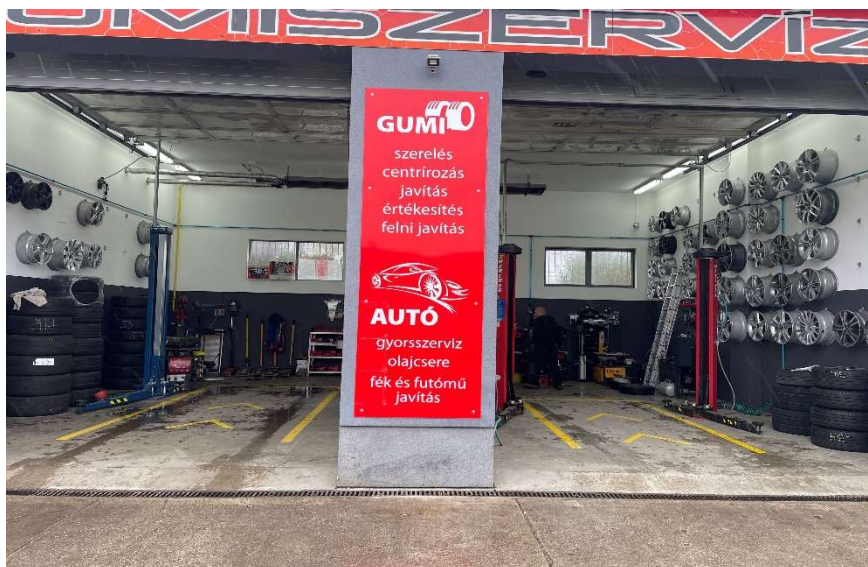
17. kép Gumiszereelő műhely szerelő állásai