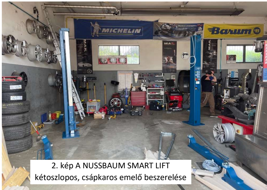
2. kép A NUSSBAUM SMART LIFT kétoszlopos, csápkaros emelő beszerelése