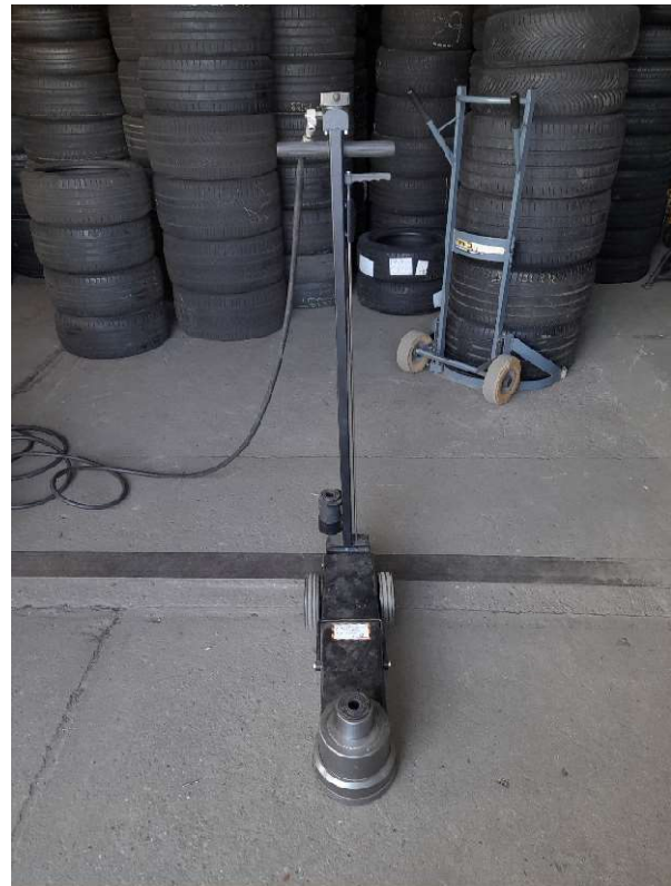
16. kép RODCRAFT AT150 Hidro-pneumatikus emelő