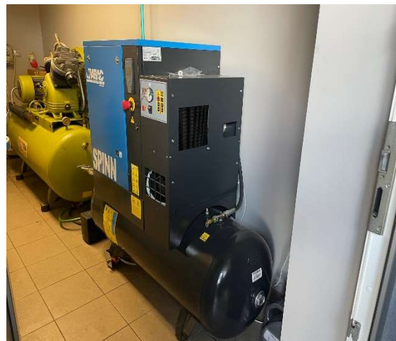
15. kép A beüzemelt ABAC_SPINN kompresszor