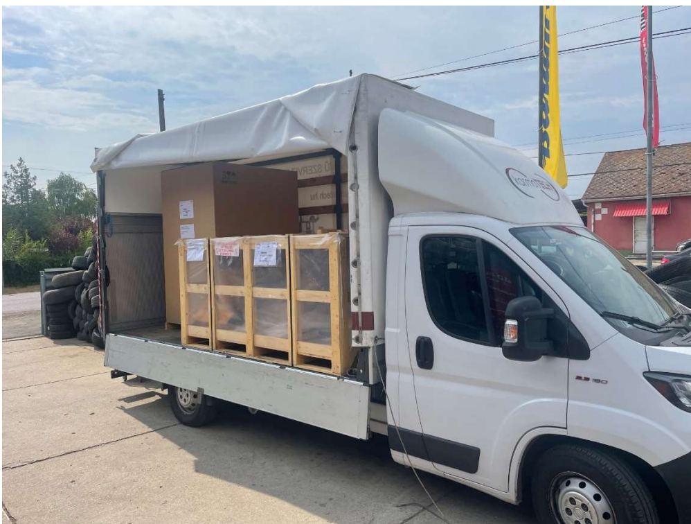
7. kép SICE S55A és SICE S48TL gumiszerelő gépek beérkezése